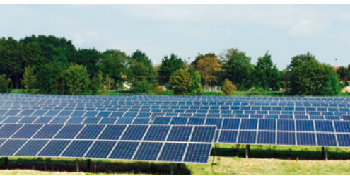
Consilium Solarpark Magdeburg (Eigene Aufnahmen)

Mit einem Investment in eine Photovoltaik-Einzelanlage erwirbt der Kapitalanleger eine eigenständige Photovoltaikanlage eines Solarparks oder Solardachs. Unser Konzept ist vergleichbar mit der Aufteilung eines Mehrfamilienwohnhauses in einzelne Eigentumswohnungen. Die Anleger erwerben somit direkt das Eigentum an einer Solarstromanlage und können steuerliche Vorteile nutzen.